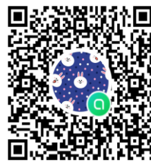
新歓オープンチャット