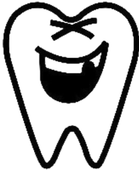
九大落研マスコットキャラクター 歯に衣着せぬちゃん